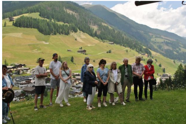
bei der Andacht