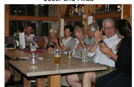
eine nette Runde