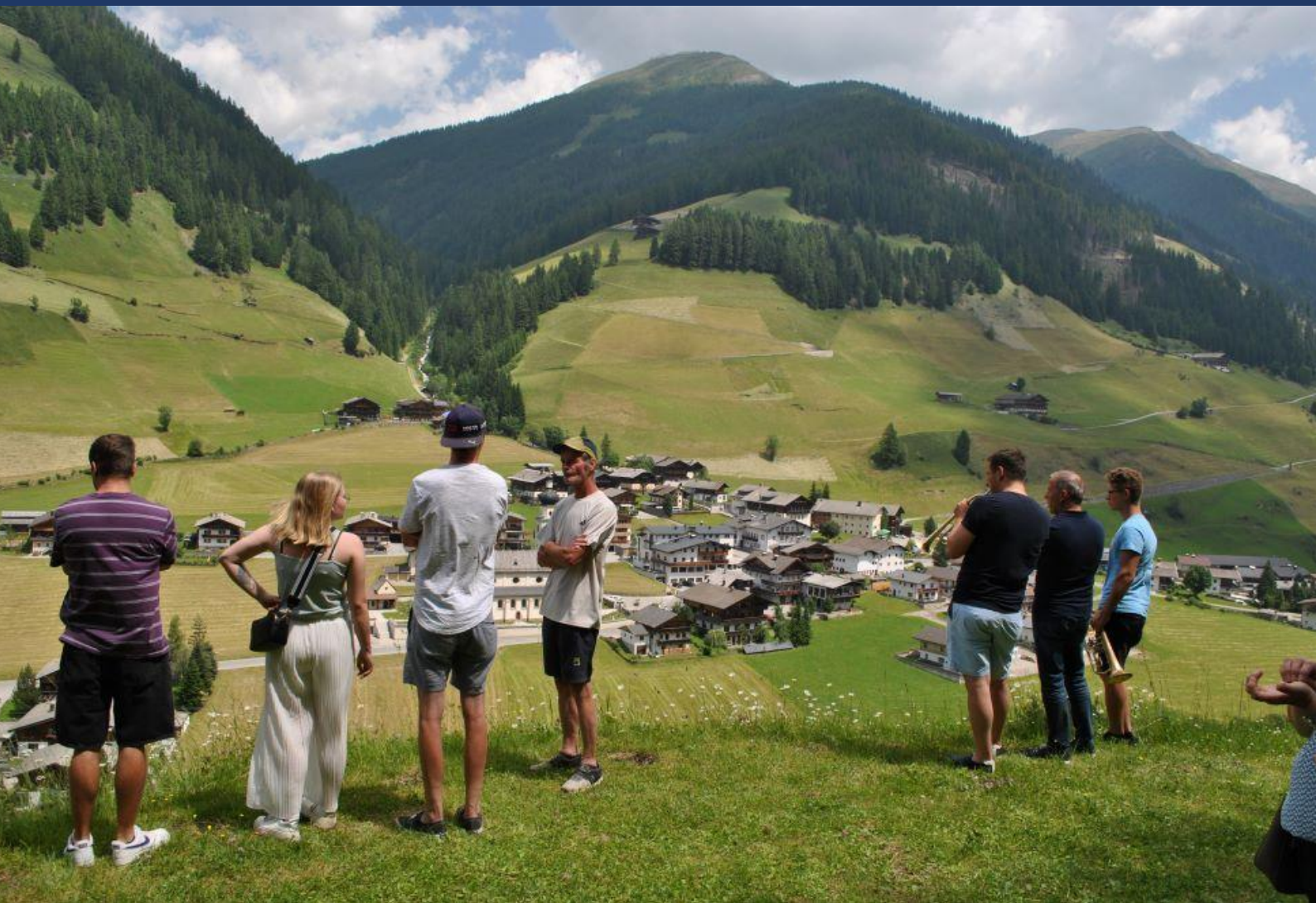
Blick von der Fürhapter Kapelle aus ins Dorfzentrum Innervillgraten